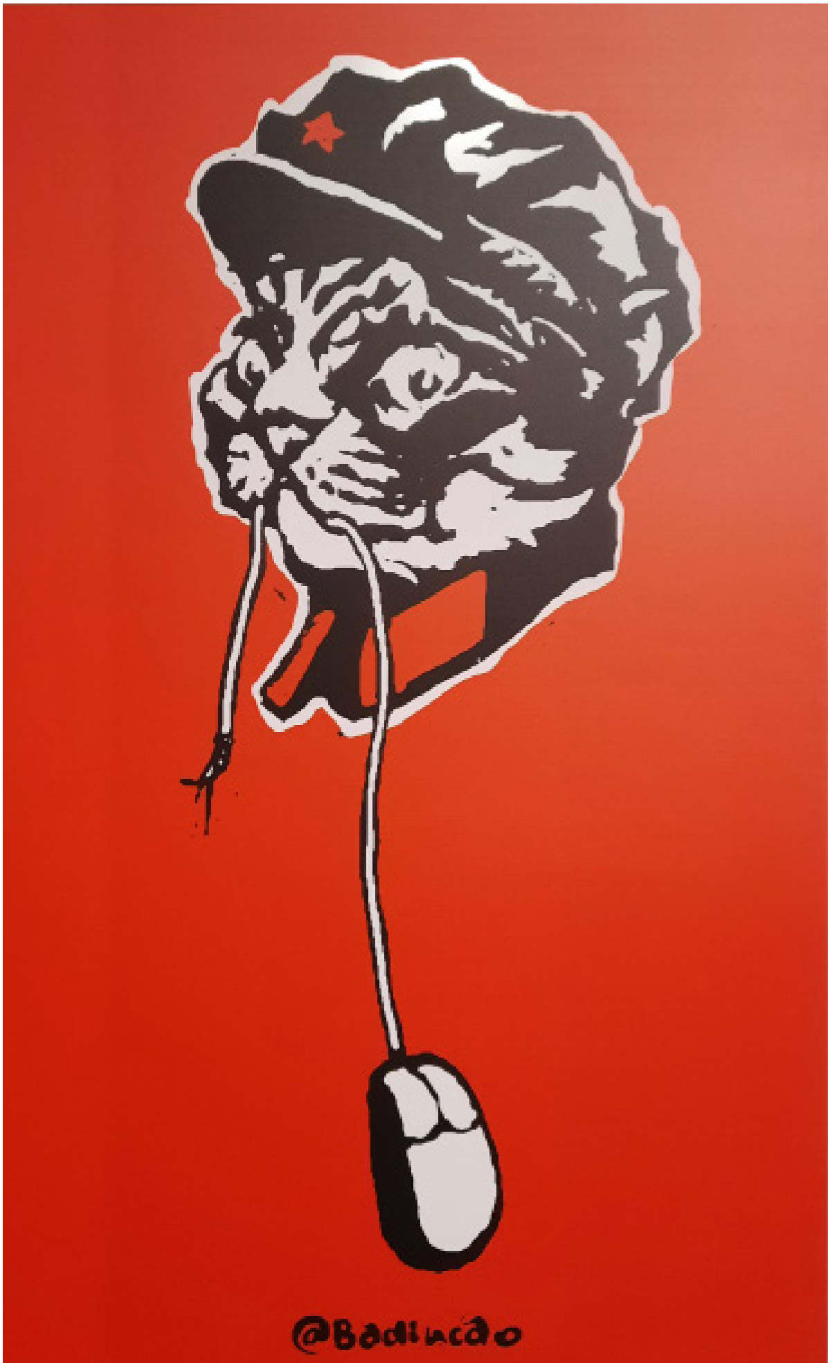
Badiucao Głodny Mao 2021