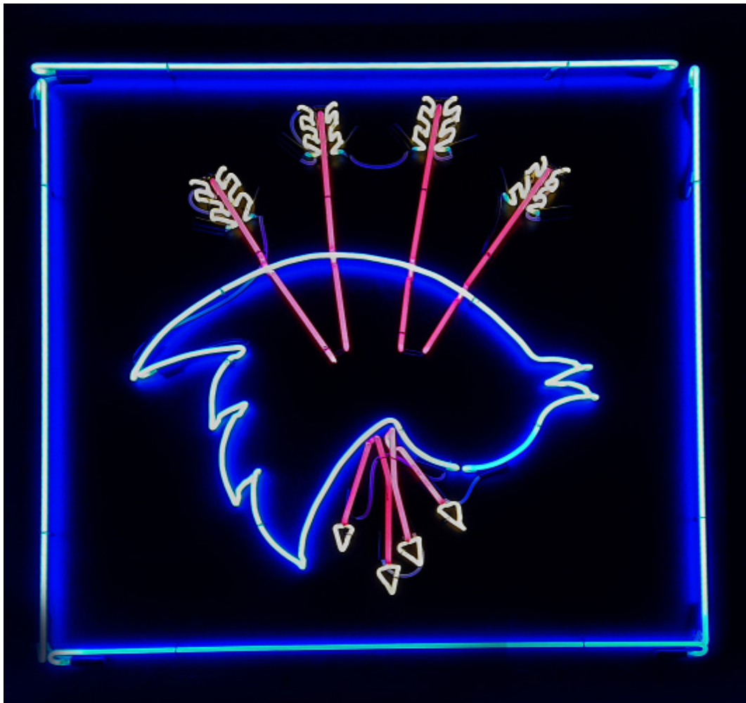
Badiucaio Twitter 2018