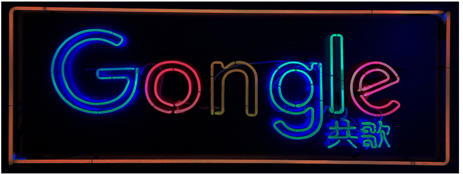
Badiucaio Google 2018