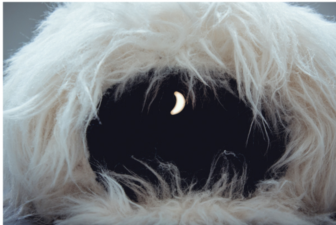
Nedko Solakov, Piękność , 2000

Autorem tej ciekawej pracy jest Nedko Solakov. To artysta z Bułgarii, który nazywany jest opowiadaczem historii, dlatego, że jego prace zawsze zawierają w sobie różne opowieści, ukryte znaczenia i sensory. Piękność może stać się dobrym punktem wyjścia do stworzenia własnej narracji, do czego serdecznie zachęcamy. Spójrz na nią jak na bohaterkę lub bohatera opowieści – zastanów się, jak tu trafiła, jak się nazywa, w jakim języku się porozumiewa, kim jest, co lubi... Daj się ponieść wyobraźni i wymyśl wyjątkową historię!