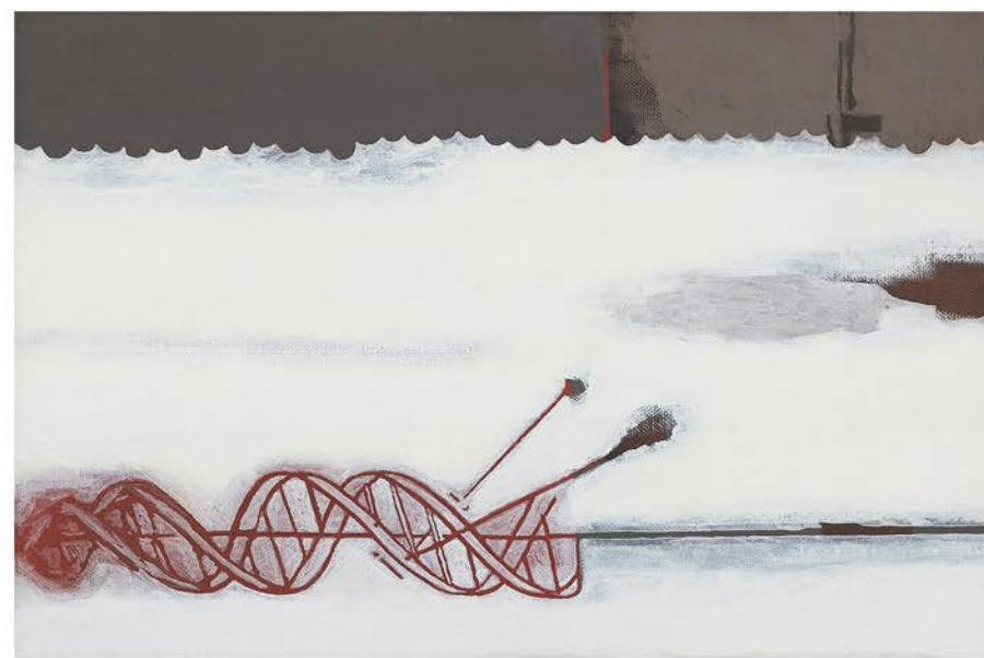
Marek Chlanda, Łańcuch z cyklu Beatyfikacje 2006–2007 , sekwencja nr IV Janusz Korczak