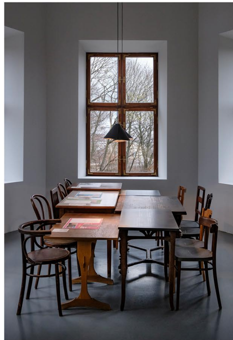
Joseph Kosuth, Ilya Kabakov, Korytarz dwóch banalności , 1994

Praca powstała na zamówienie Centrum w 1994 roku w ramach wystawy Josepha Kosutha oraz Ilji Kabakova pod tytułem Korytarz dwóch banalności . Na stu dwudziestu ustawionych rzędem stołach Rosjanin Ilya Kabakov pokazał wytwory sowieckiej propagandy i donosy mieszkańców domów komunalnych w Moskwie na sąsiadów, a Amerykanin Joseph Kosuth zaprezentował cytaty z wypowiedzi historycznych postaci, nie bojąc się przy tym sięgania do słów osób kojarzonych z systemami totalitarnymi. Biegająca przez wszystkie stoły linia podziału, utworzona przez zetknięcie uporządkowanej, chłodnej, szarej powierzchni zajętej przez Kosutha ze zużytą i odrapaną płaszczyzną należącą do Kabakova, buduje konkretną narrację. Na szarym tle duże, białe, eleganckie, wykonane sitodrukiem litery, naprzeciw kserograficzne kolaże utworzone z maszynopisów oraz pocztowych kartek, ozdobionych radziecką ikonografią propagandową. Praca ma bezcenny charakter, jest bowiem szczególnym świadectwem jednorazowej współpracy artystów konceptualnych: Josepha Kosutha oraz Ilji Kabakova.