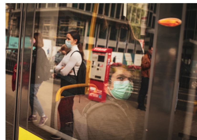
Fot. Magdalena Piejko