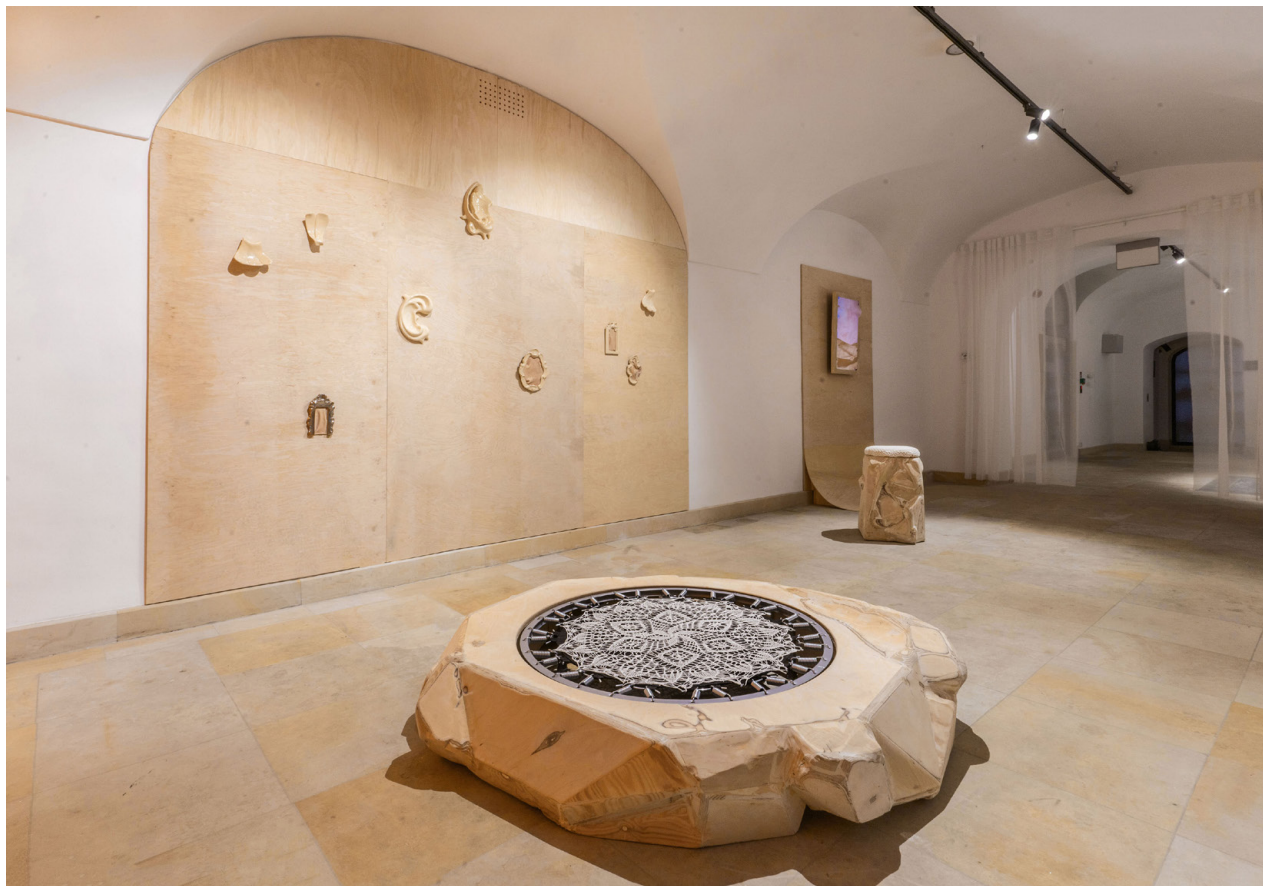
↓ Stańczykini, żywica, ready made, 2024