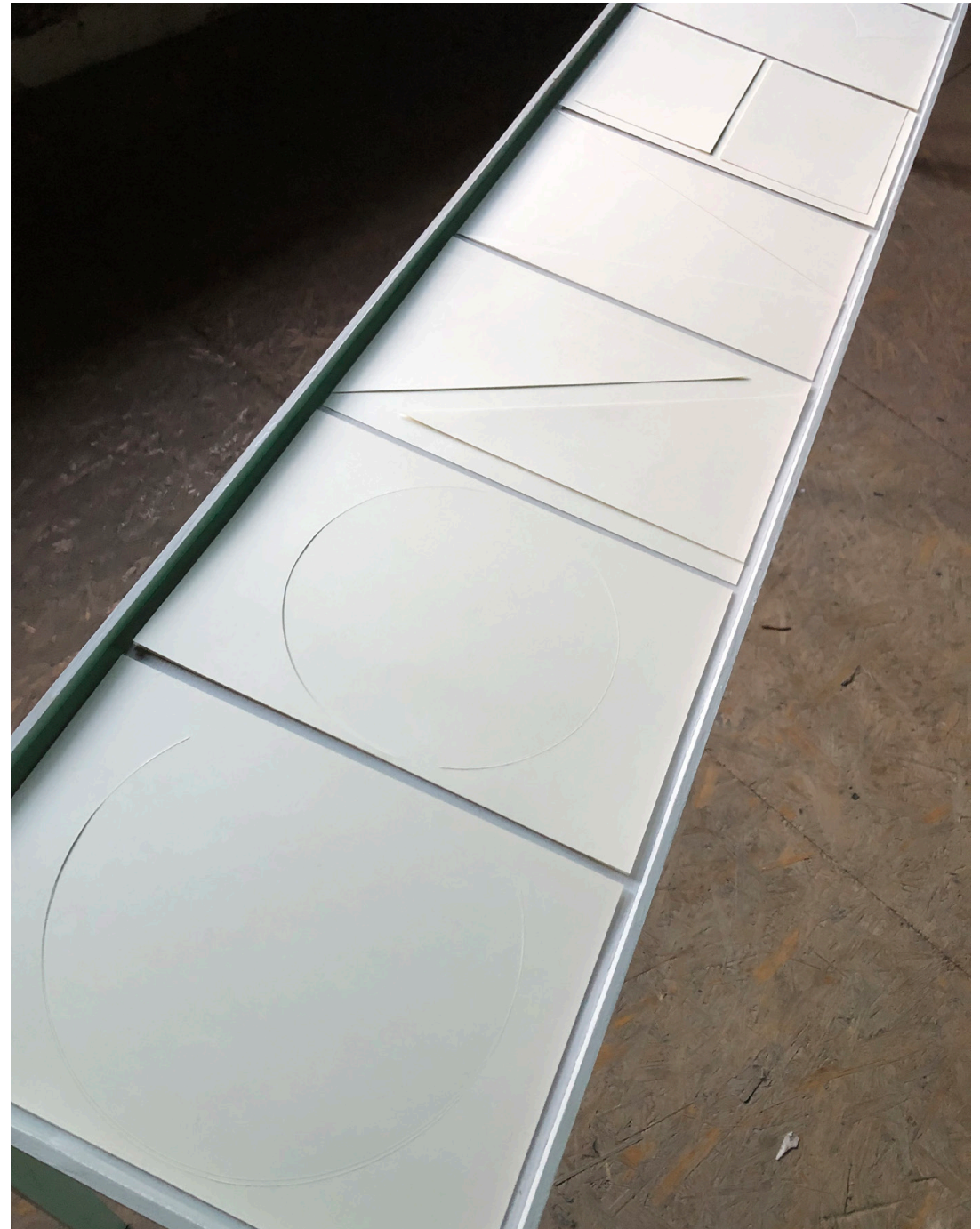
The Materiality of Conversation, papier, moduł 210 × 297 mm, 2023