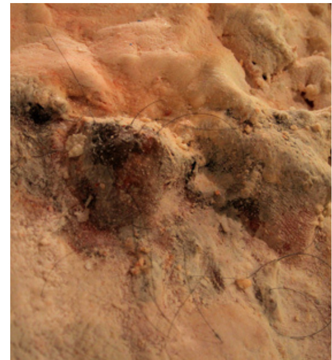
"The Hummingbird" | 2013 | Watou Art Festival, Belgium

"The Hummingbird" podejmuje problem zaburzeń w procesie kształtowania własnego wizerunku. Presja wywierana na nas przez społeczeństwo, media, kulturę oraz nasze osobiste przekonania tworzy ogromną przepaść między tym, kim jesteśmy, a tym, kim wierzymy, że powinniśmy być. Im większa odległość między tymi dwoma perspektywami, tym bardziej destrukcyjny staje się proces budowania własnej tożsamości.