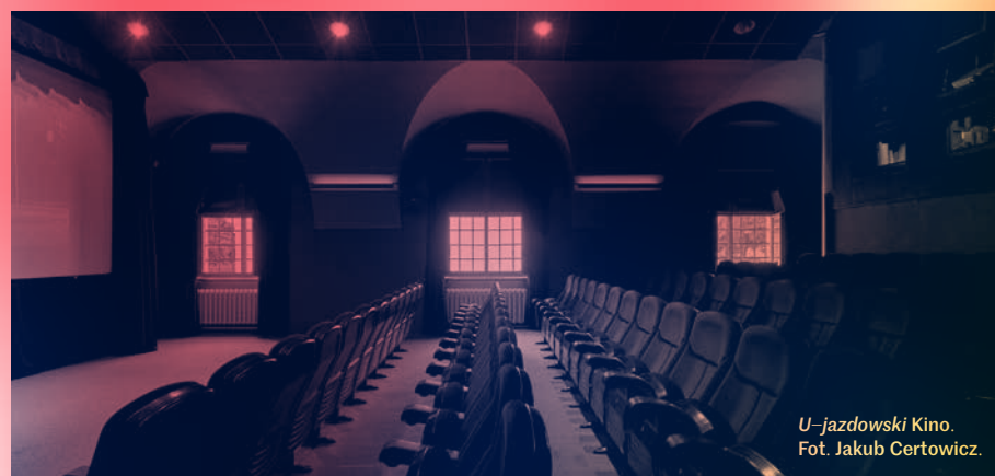
U-jazdowski Kino.

Sztuka współczesna jest dla nas narzędziem badania i interpretacji różnorodnych zjawisk. Artyści, dysponując takimi środkami jak wyobraźnia, intuicja, wrażliwość i rygor, potrafią dostrzec niewidoczne lub pomijane aspekty rzeczywistości i rzucić na nie nowe światło, a także – lepiej niż ktokolwiek inny – pobudzić ciekawość.