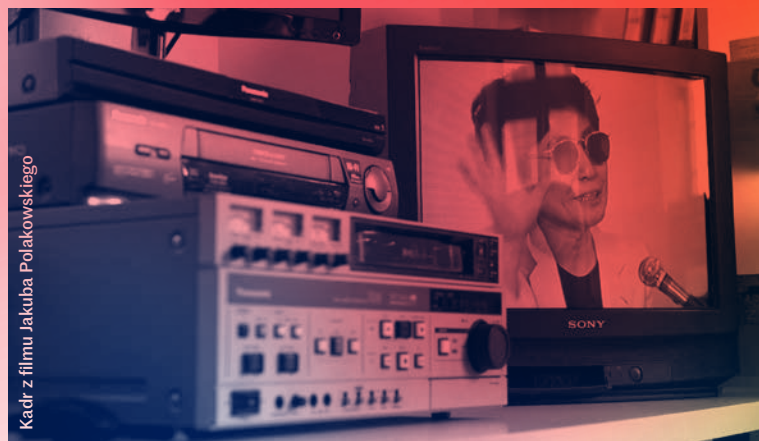
Kadr z filmu Jakuba Polakowskiego