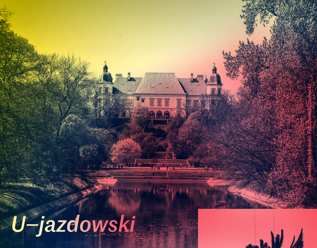
Zamek Ujazdowski.