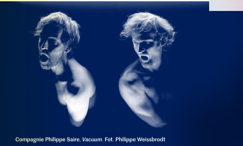
Compagnie Philippe Saire, Vacuum .

Centrum Sztuki Współczesnej Zamek Ujazdowski to miejsce, w którym poprzez sztukę staramy się przemyśleć rzeczywistość.