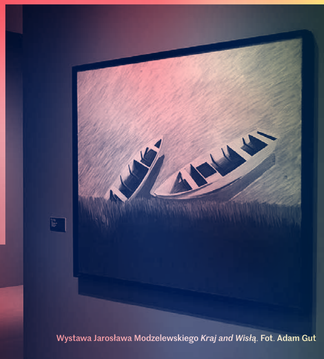
Wystawa Jarosława Modzelewskiego Kraj and Wisła .