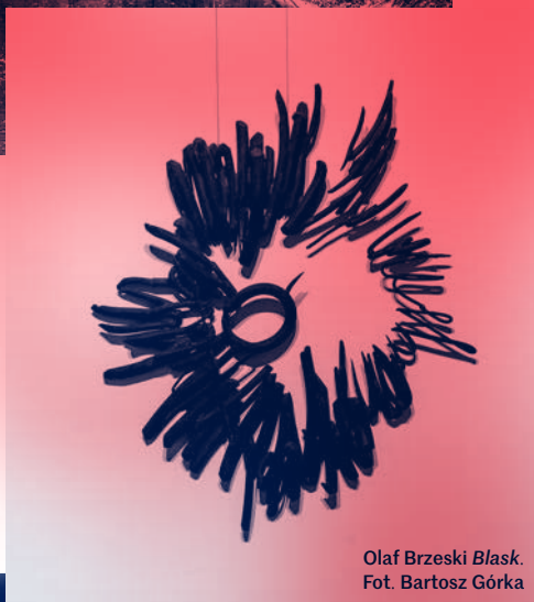
Olaf Brzeski Blask .

W centrum Warszawy, w zamku położonym obok Łazienek Królewskich, prezentujemy wystawy, spektakle, działa tu kino, biblioteka i program rezydencji artystycznych. Wydajemy publikacje, przybliżamy idee artystów w trakcie warsztatów i oprowadzań, zapraszamy do dyskusji. Różne dziedziny sztuki współistnieją tu i przenikają się, tworząc nowe zjawiska. Zapraszamy wszystkich zainteresowanych sztuką.