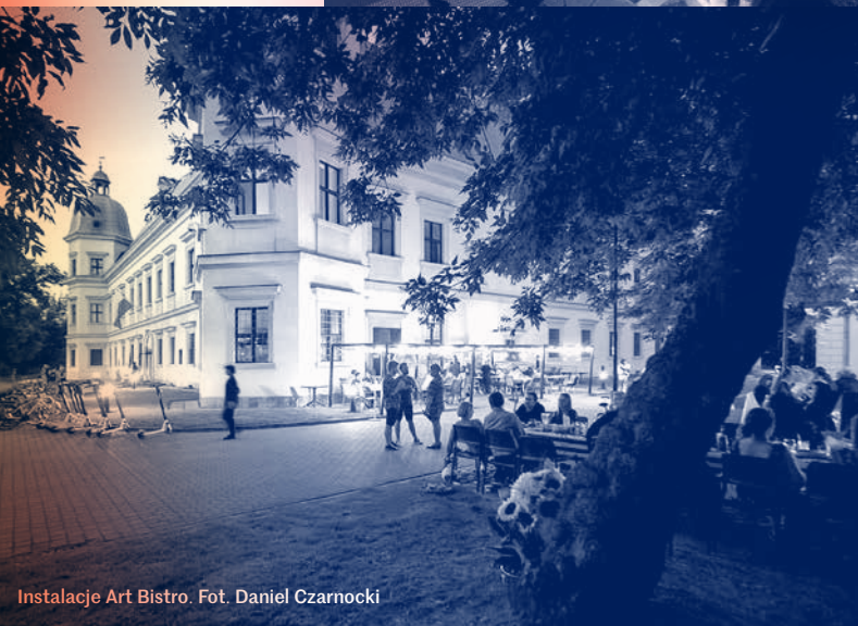
Instalacje Art Bistro.