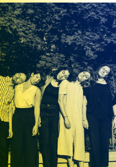
Uczestnicy rezydencji kuratorskich Re-Directing: East , 2019.

Prezentujemy wybrane zjawiska z pogranicza tańca współczesnego, teatru i sztuk wizualnych. Organizujemy pokazy spektakli, warsztaty i rezydencje twórcze, spotkania z artystami, prelekcje i projekcje filmów o sztukach performatywnych.