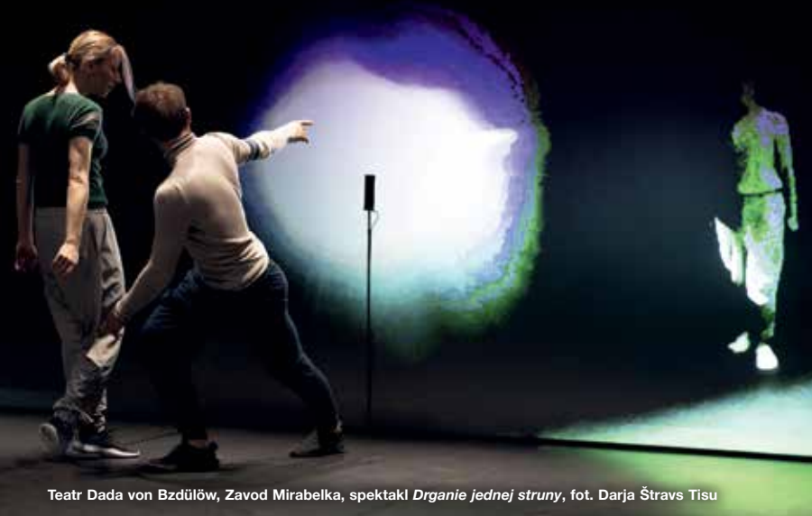
Teatr Dada von Bzdülów, Zavod Mirabelka, spektakl Drganie jednej struny , fot. Darja Štravs Tisu

Spektakl taneczno-multimedialny i spotkanie z artystami