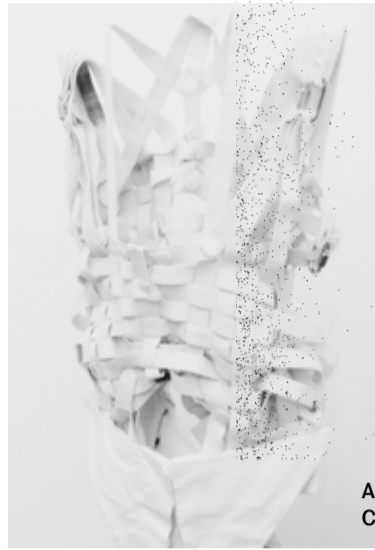
Afra Kirchdorfer Clothing System, 2017