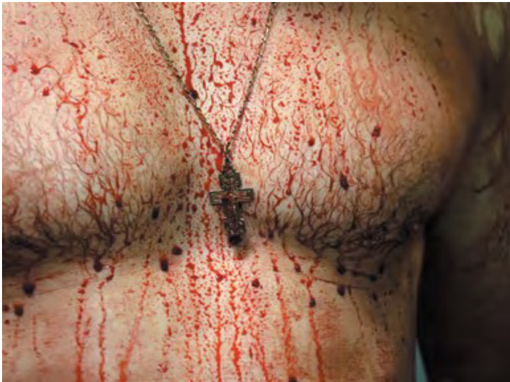
Andriy Boyko, Zdjęcie dokumentalne